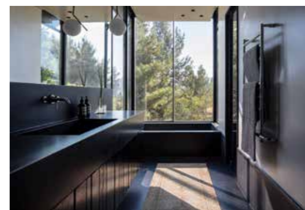
במרכז - מימין: מבט מחדר הרחצה של המסטר. משמאל: חומרים אל זמניים בנויים את הגשר המקשר בין חדרי הילדים למסטר.