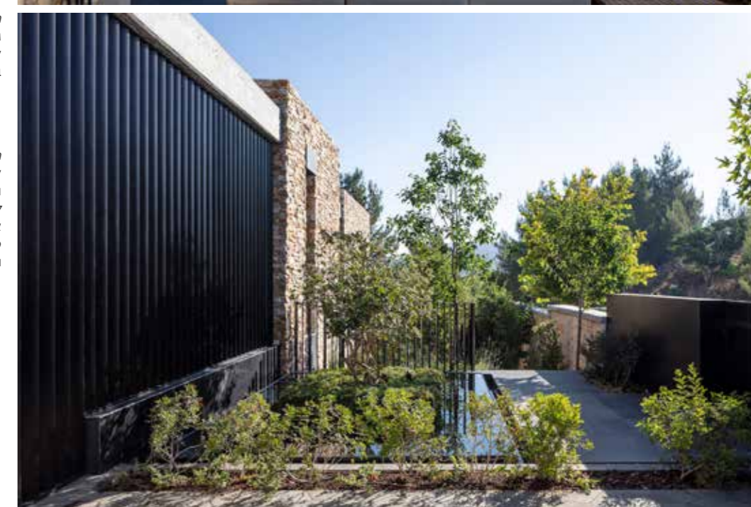
משמאל – למעלה: מבט למדרון הררי המשקיף על הטביבה המיוערת והים למטה: מבט לילי; חזית צד, בניה מאבן לקט טבעית בהשראת הטראסות החקלאיות.