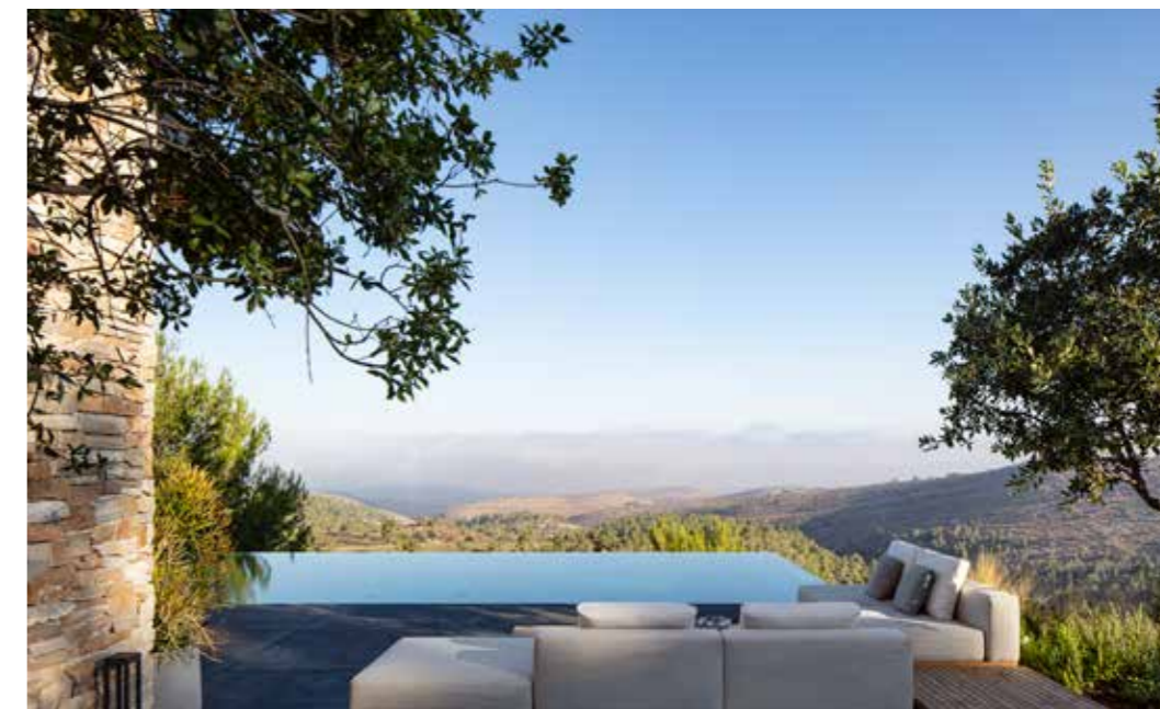
מימין – למעלה: בריכת גלישה מביטה לנוף ההררי למטה בריכת שיקוף בכניסה לבית.