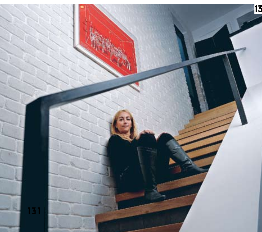
(7) חדר הטלוויזיה בקומה השנייה (8) חדר האמבטיה (9) דימוי ספריית עץ, עבודה של אמן שוויצרי (10) המטבח. ארונות בצביעה, ואי מרכזי לבישול בחיפוי המשלים את אריחי הרצפה (11) חדר השינה של אחת הבנות (12) מנורות ימאים מפליז משלימות את הרצף הסגנוני בין הסלון למטבח (13) העלייה לקומת הגג, מדרגות עץ אלון על בטון אפור

פינה אהובה: "אלמנט עיצובי שמוסיף לאמירה האישית הוא ריצוף המבואות והמרפסות באריחי בטון מצוררים, שנעשו על פי הזמנה ביבוא אישי מטורקיה. בדרך זו התאפשר ייצור של תבניות ופלטות צבעים לפי הצורך ולפי הטעם האישי. יש לי חיבה רבה למבואות – כמקומות שמייצרים תחושה של התכווננות, השהיה, מעבר בין מצבים. חלל המבואה של הדירה יוצר חוויה כזאת, של שהות במעבר מהאזורים הציבוריים אל חדרי השינה. יתרונה של המבואה גם בריאלוג החזותי שהיא מנהלת בין חללי הבית השונים."